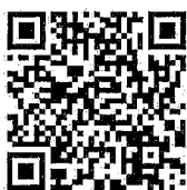
聯合國永續發展目標(SDGs)中譯版