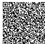
仿生設計思考介紹