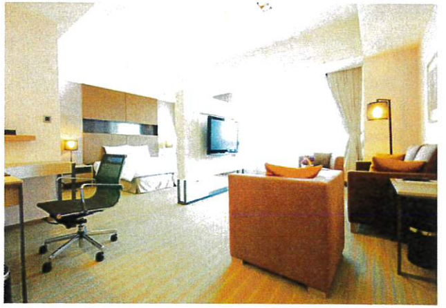
■ 商務套房 Business Suite (約18坪)