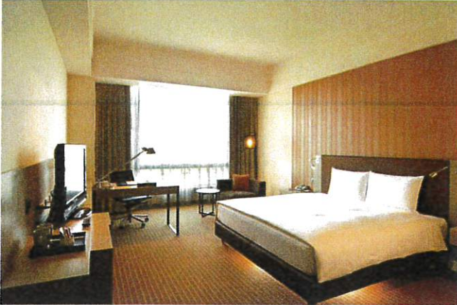
■ 商務單床房 Business Single Room (約12坪)