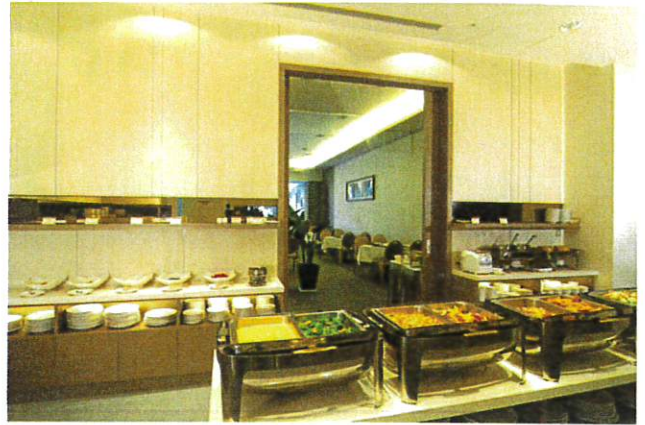
■ 早餐用餐區 Breakfast Area