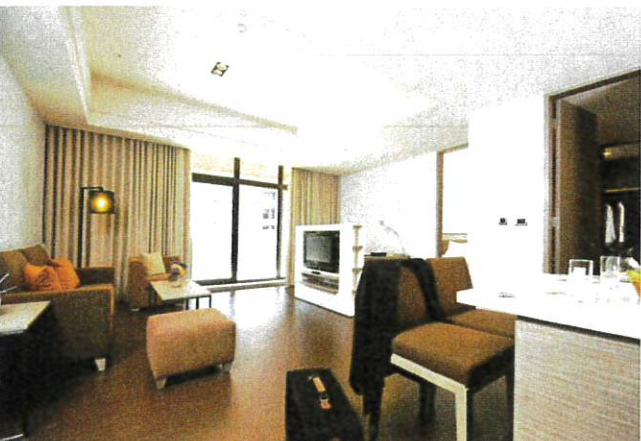
■ 豪華套房 Deluxe Suite (約26坪)