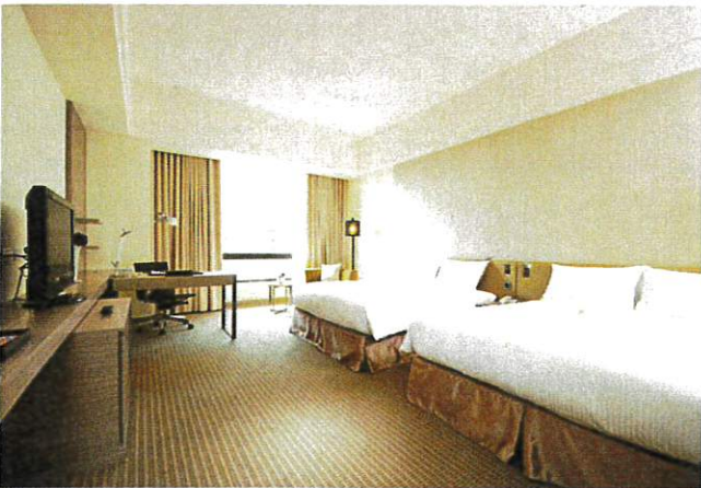
■ 豪華雙床房 Deluxe Twin Room (約13坪)