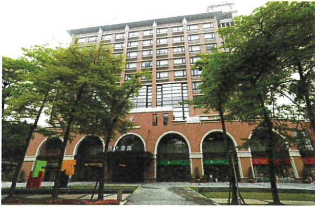
■ 成大會館 Zenda Suites