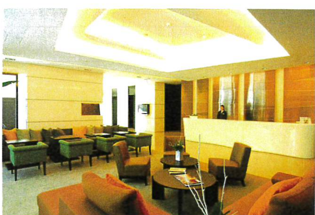
■ 大廳 Lobby