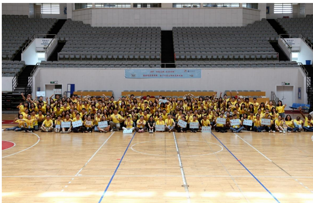
全体队员举行团队建设活动