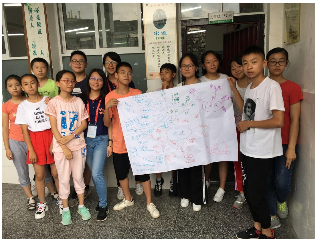
在支教地与当地学生们举行团队建设活动