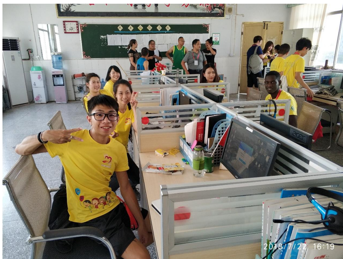
恩施二组集体备课