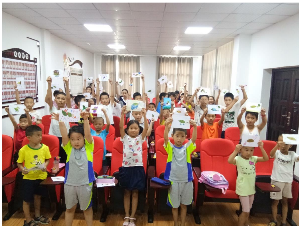
支教课堂上学生们展示课堂成果