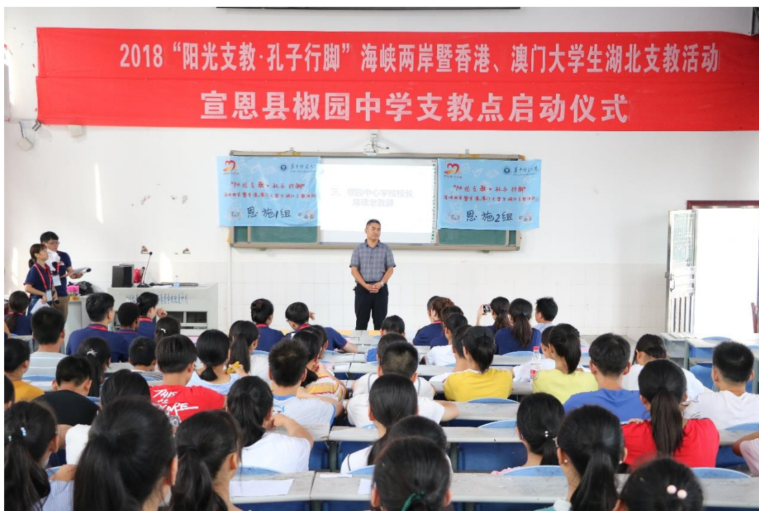
在宣恩县椒园中学支教点举行开班仪式