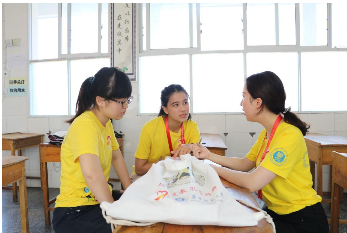
两岸支教队员们课间交流