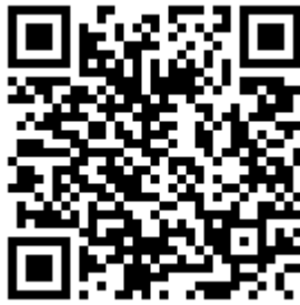
悠遊卡交易記錄查詢 QR CODE