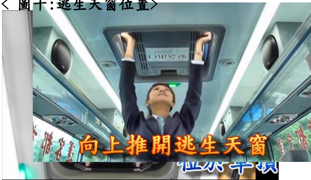
< 圖十：逃生天窗位置 >