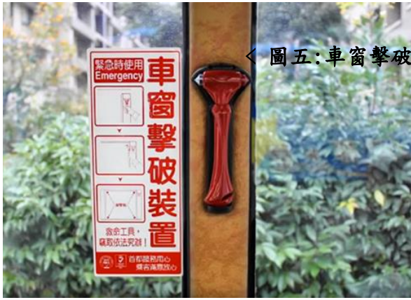
< 圖五：車窗擊破器方式 >