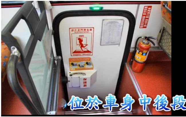
< 圖八：向內拉開開關 >