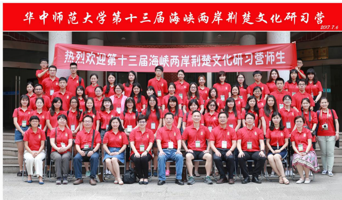
第十三届荆楚文化研习营大合影