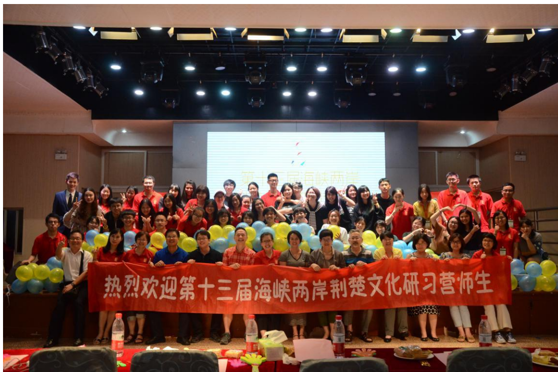
联谊晚会集体合影