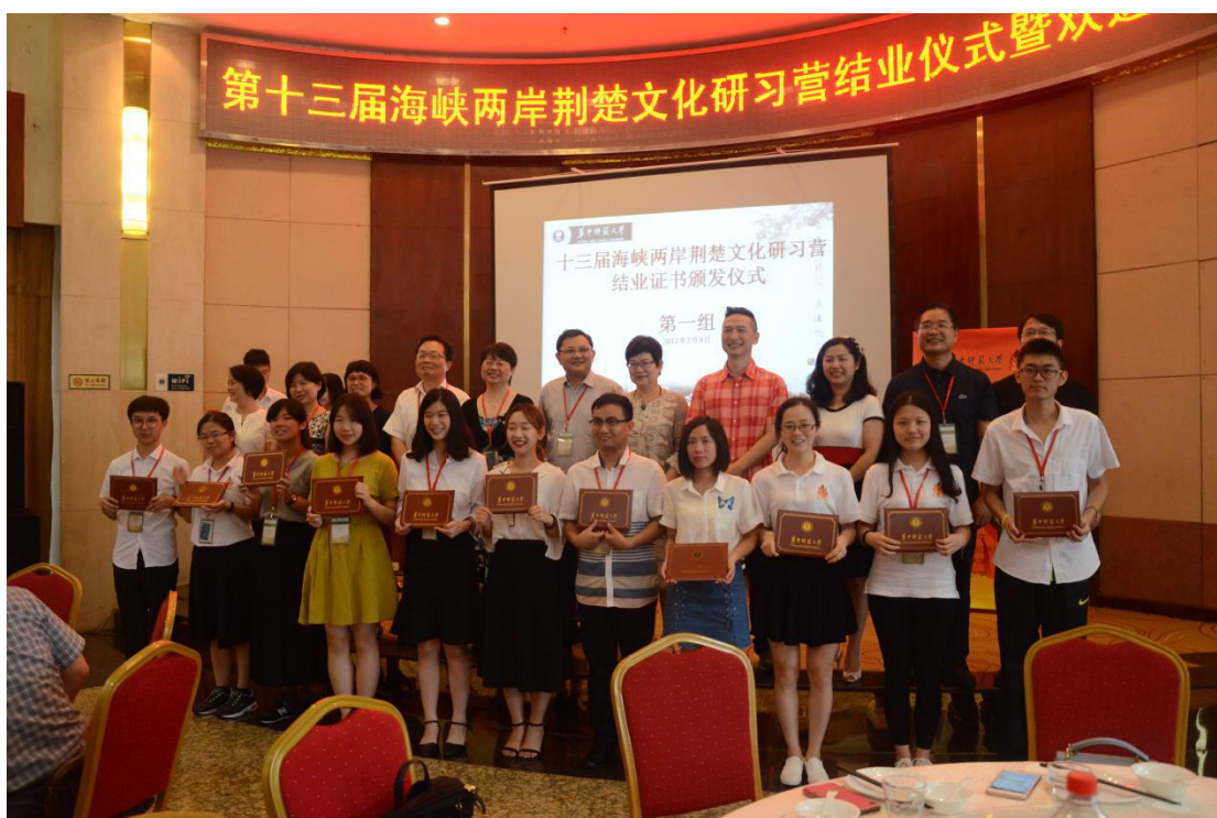
第十三届海峡两岸荆楚文化研习营结业仪式