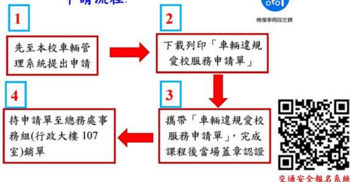
< 圖十四:交通安全課程海報 >