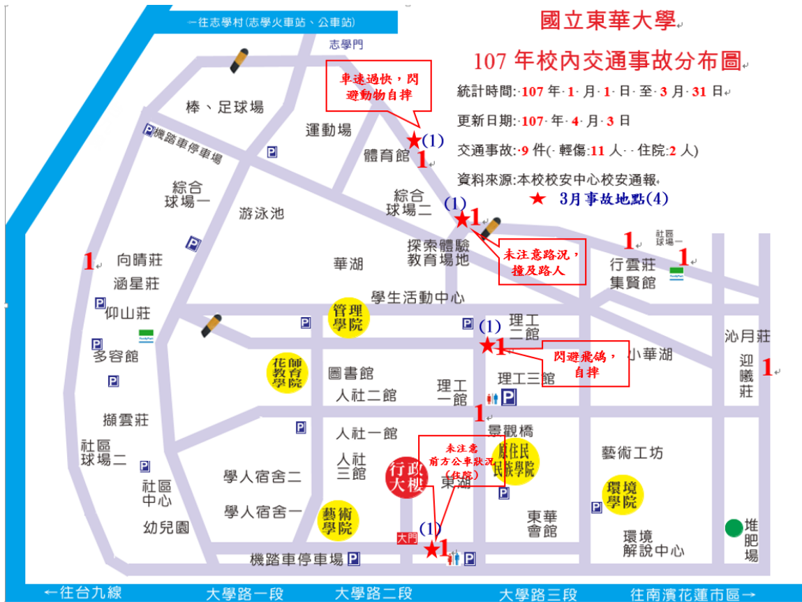
< 圖一: 107 年 1 至 3 月校內交通事故分布圖 >