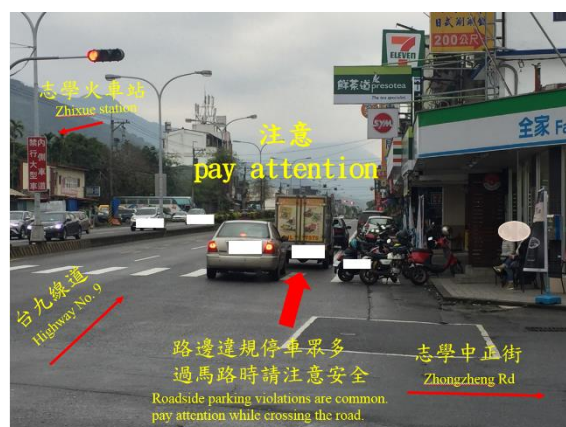
〈圖四：路邊違規停車示意圖〉