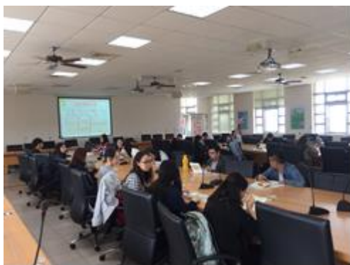
說明：107. 3. 20 星光班代交通安全宣導 地點：行政大樓 416 會議室