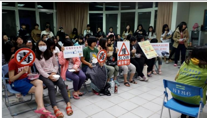
說明：107. 3. 1-9 莊民大會交通安全宣導 地點：各莊