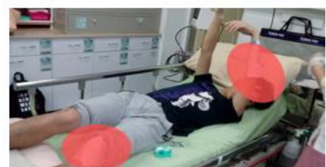
< 圖八: 107/03/24 車禍示意圖 >