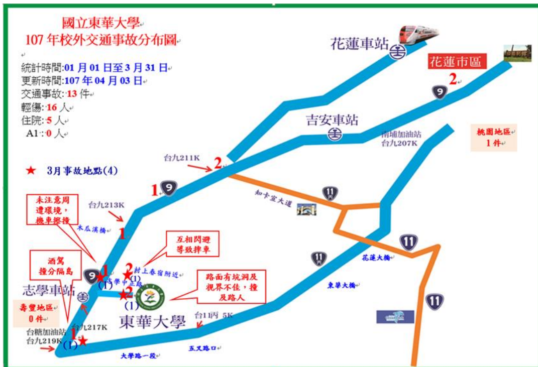
< 圖二: 107 年 1 至 3 月校外交通事故分布圖 >