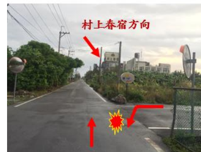
< 圖十一:107/03/16 車禍示意圖 >