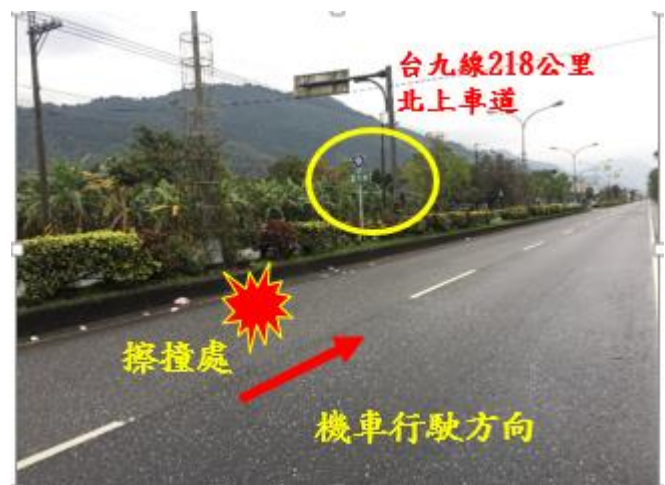
< 圖十二:107/03/09 車禍示意圖 >