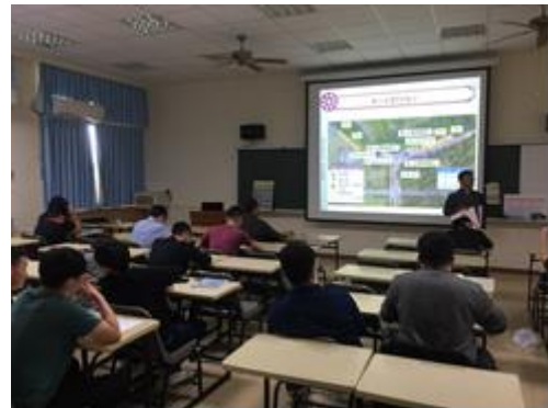
說明：107. 3. 16 光電系入班宣導 地點：理工二館 C403 教室