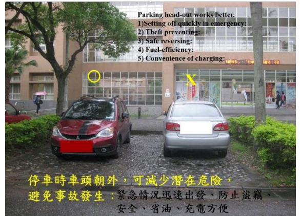
< 圖五:停車時車頭朝外示意圖 >

如果車頭向裏，一旦遇到緊急情況掉頭、倒車，就算技術好的也會浪費一定的時間。但車頭向外停車就沒有這個問題，既節省時間，出發速度還快。