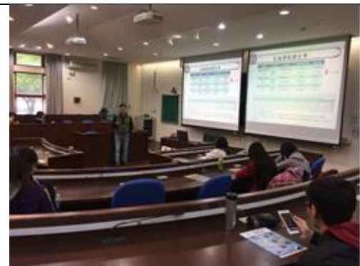
說明：107. 3. 21 華文系入班宣導 地點：人社一館第二講堂