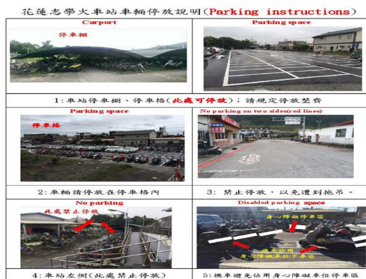
< 圖六: 志學火車站車輛停放示意圖 >

Please follow traffic regulations when operating any vehicle. Also remember to wear a helmet whenever you're riding a scooter/motorcycle to prevent any traffic accident. Being a bit more careful means being a bit safer.