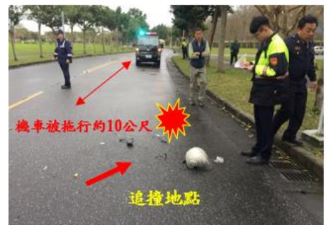
< 圖九:107/03/08 車禍示意圖 >