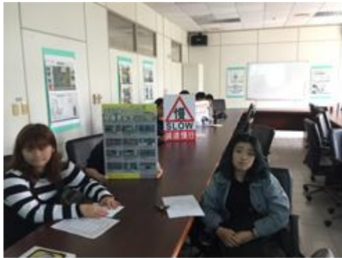
說明：107. 3. 14 交通安全教育日入班宣導 地點：行政大樓 214 室