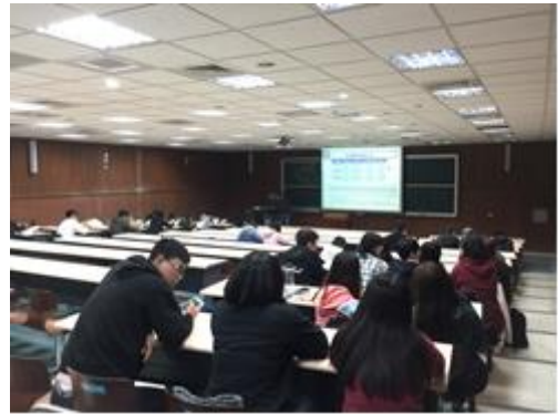
說明：107. 3. 8 社會系入班宣導 地點：人社二館第三講堂