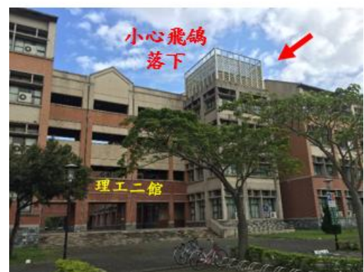
< 圖七: 107/03/29 車禍示意圖 >