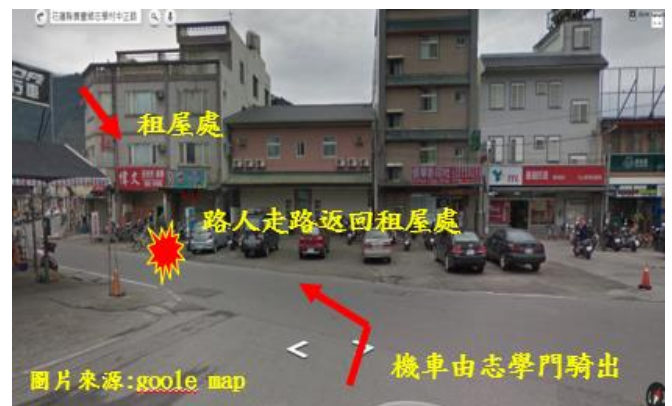
< 圖十:107/03/21 車禍示意圖 >