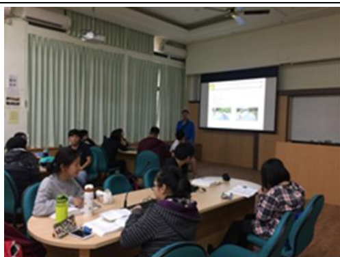
說明：106.11.20 英美系大一入班宣導 地點：理工二館 E105 教室