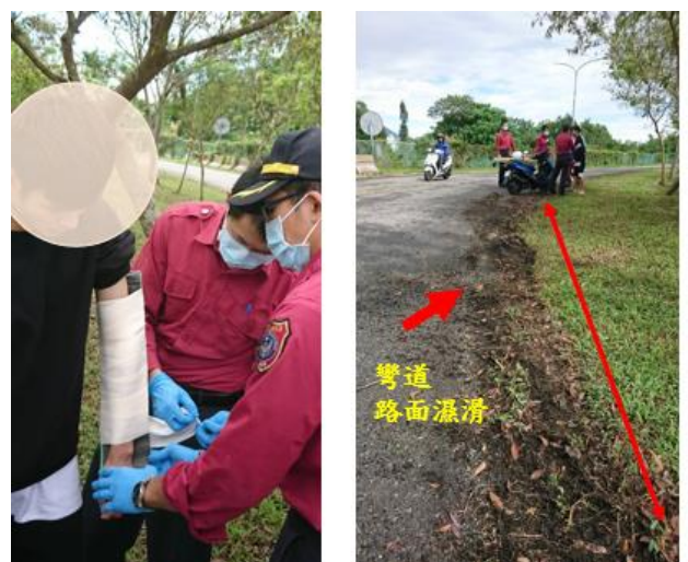
< 圖七：106/11/21-2 禍示意圖 >