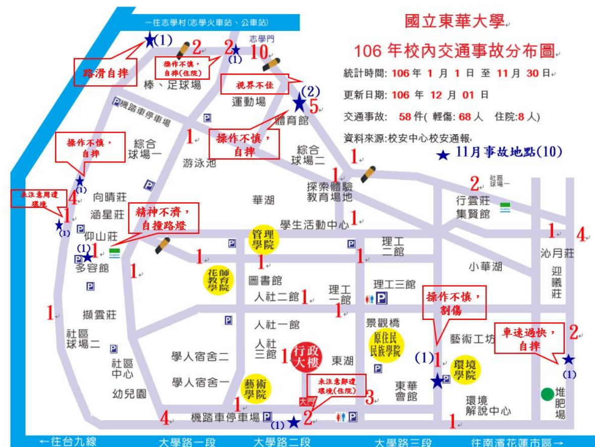
〈圖一：106年1至11月校內交通事故分布圖〉