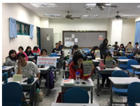
說明：106.11.22 教行系入班宣導 地點：花師學院 B119 教室