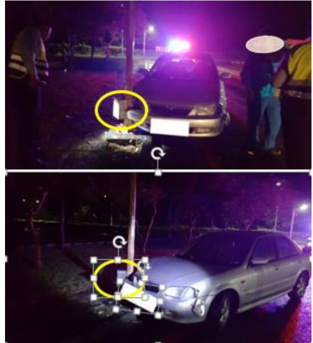
< 圖八:106/11/20 車禍示意圖 >