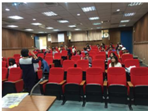
說明：106.11.30 英美系大一入班宣導 地點：人社二館共五講堂