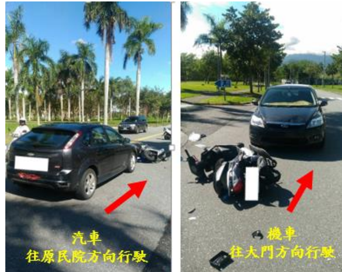
< 圖六：106/11/21-1 車禍示意圖 >