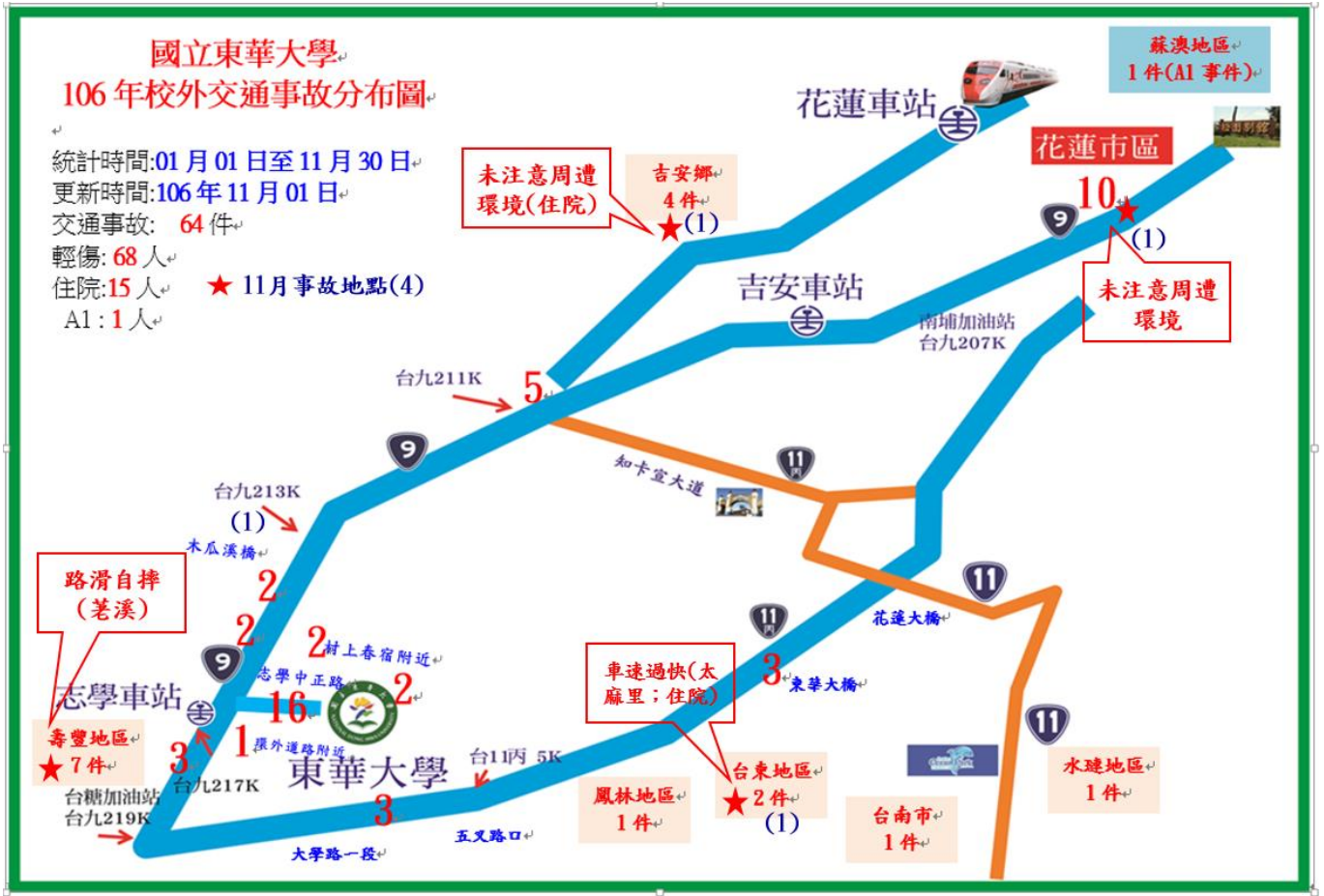
< 圖二: 106年1至11月校外交通事故分布圖 >