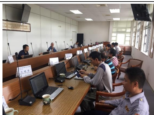
說明：106.11.28 交通安全暨車輛管理委員會 地點：行政大樓 303 會議室