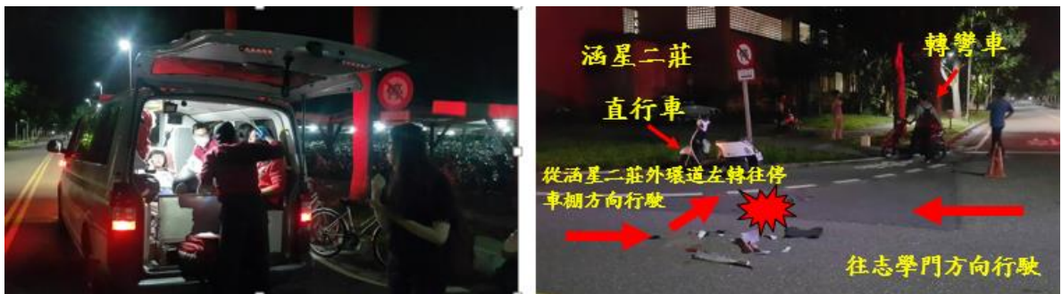
< 圖十:106/11/10 車禍示意圖 >