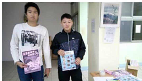
說明：106.11.16 校外住宿交通安全宣導 地點：東華新世紀活動中心