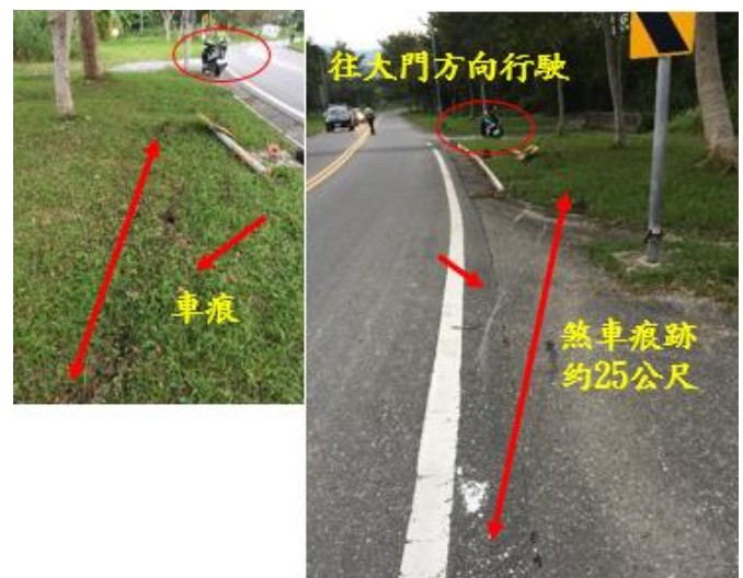
< 圖九:106/11/16 車禍示意圖 >