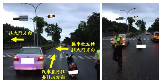
< 圖十六:106/10/05 車禍示意圖 >