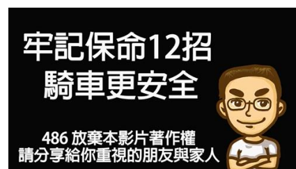
< 圖八：騎車保命12招海報 >