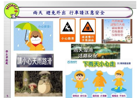
〈 圖七：交通安全宣導海報 〉

此外連續雨天易致柏油馬路產生小坑洞或路面下陷等危險因素，尤其雨天及夜間騎機車時視線不佳，盡量避免外出。如需外出提醒同學穿著鮮明雨衣外套並減速慢行。