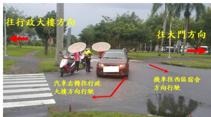
< 圖十四:106/10/12 車禍示意圖 >