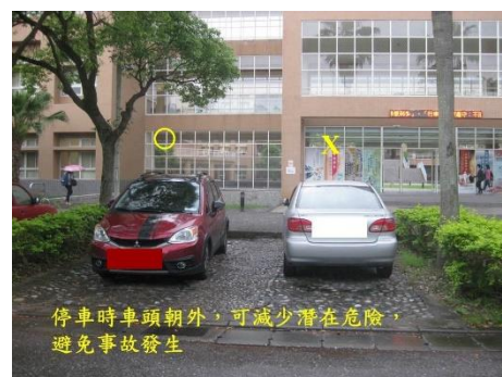
< 圖六:停車時 車頭朝外示意圖 >