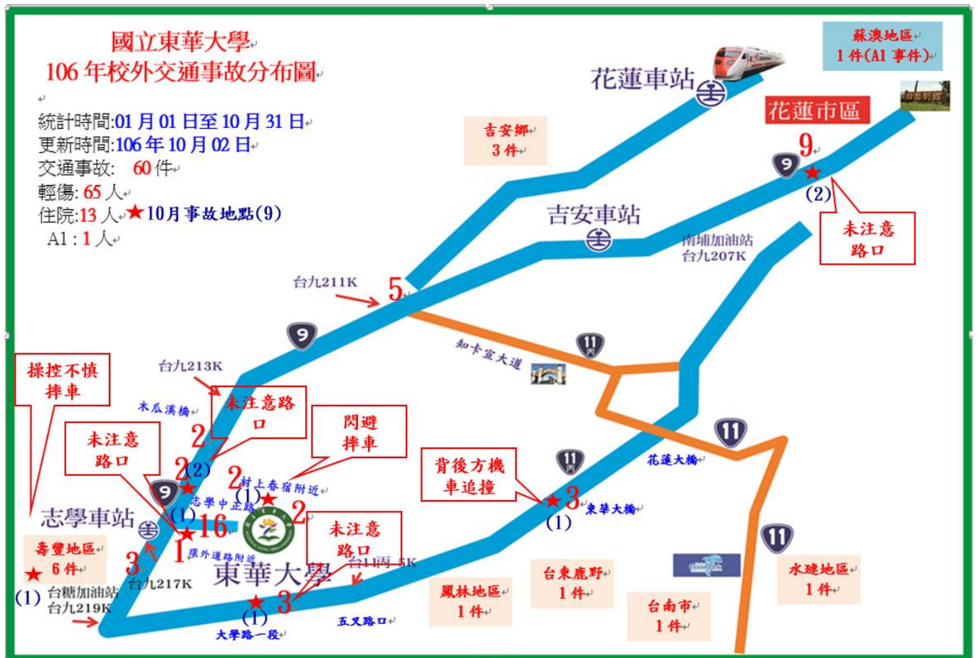
< 圖二: 106年1至10月校外交通事故分布圖 >