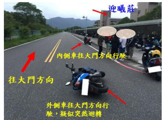
< 圖十三:106/10/21 車禍示意圖 >