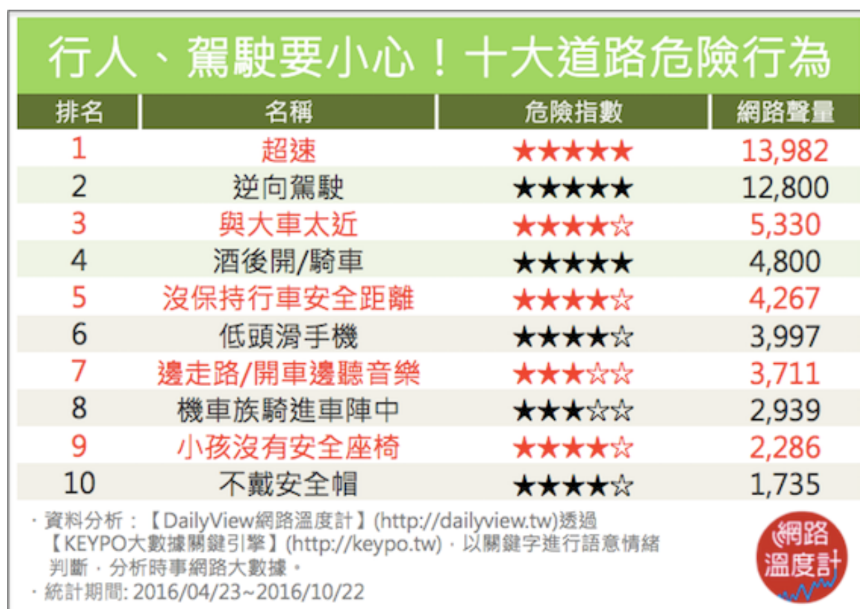
< 圖四：十大道路危險行為 >