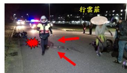
< 圖十一：106/10/31 車禍示意圖 >