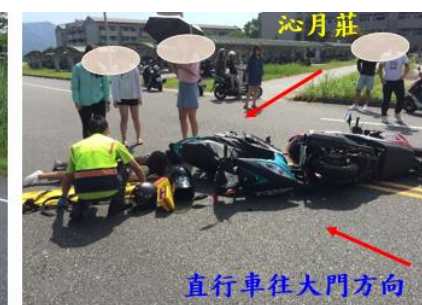
< 圖十二：106/10/27 車禍示意圖 >