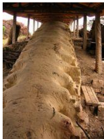
陶都宜興保存的明代龍窯遺址

從明武宗正德年間以來紫砂開始製成壺，名家輩出，500 年間不斷有精品傳世。據說紫砂壺的創始人是中國明朝的供春。古來名壺，從明正德嘉靖年間供春的樹瘿壺、六瓣圓囊壺，每一把壺都獨具匠心，在壺的欣賞性上下功夫。因為有了藝術性和實用性的完美結合，紫砂壺才這樣珍貴，令人回味無窮。更加上紫砂壺泡茶的好處、和茶禪一味的漢族文化內涵，這就又增加了紫砂高貴不俗的雅韻。