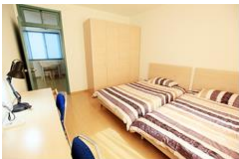
臥室（上下鋪臥室配置相同）