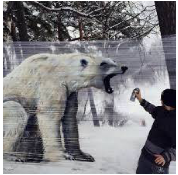
工業棧板膜之噴漆呈現效果示意圖