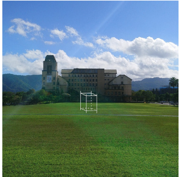
實際位置示意圖（白線）