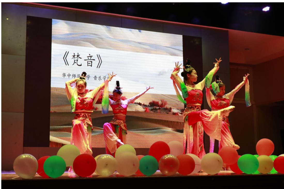
图 20 两岸师生联谊晚会