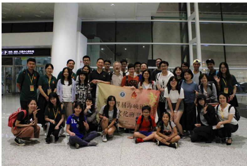
图 1 机场初次相遇