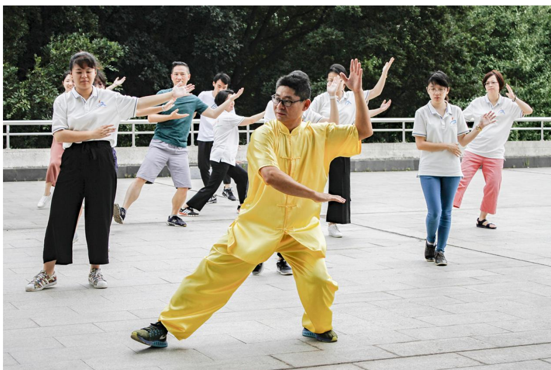
图 14 中华武术与趣味养生晨练