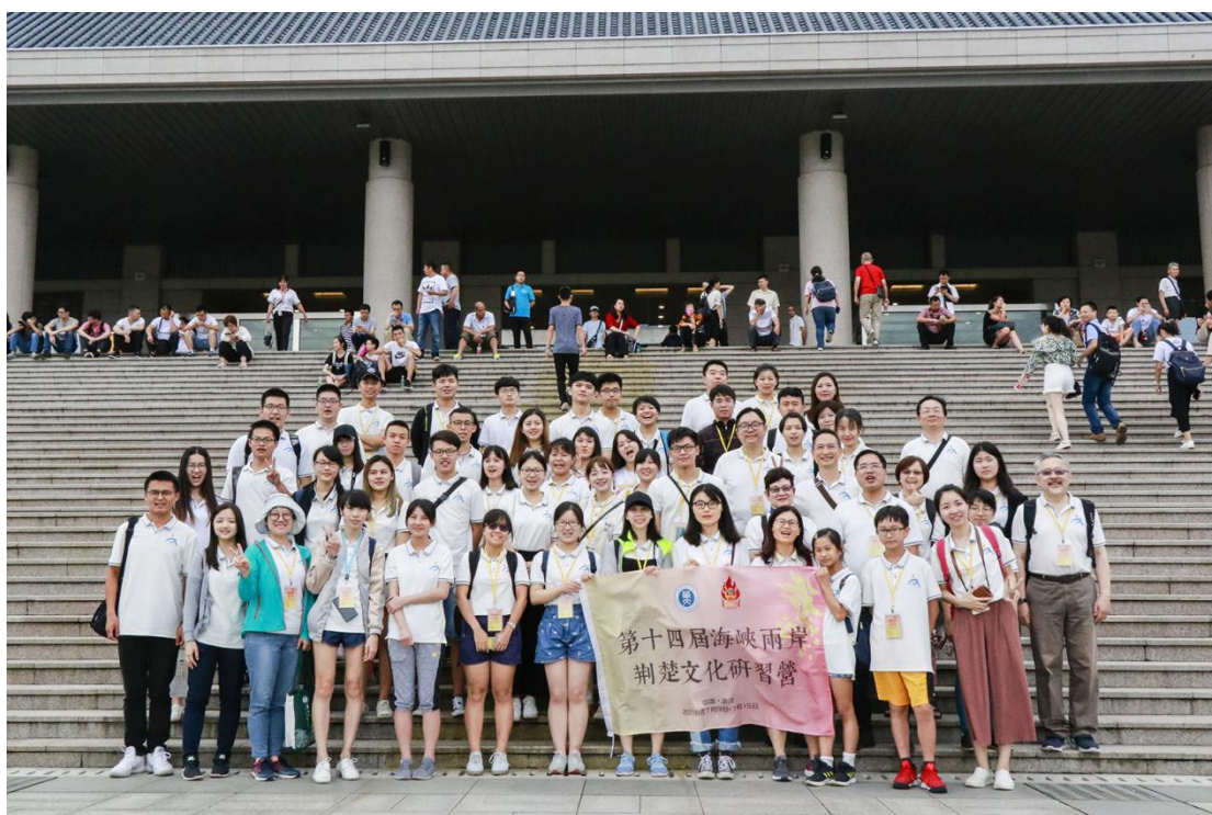
图 12 省博物馆参访