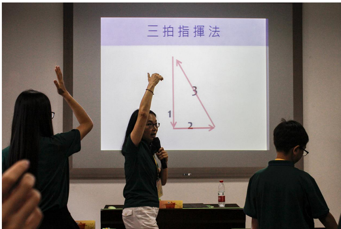
图 11 音乐里的密码讲座