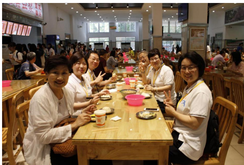
图 2 食堂共进早餐