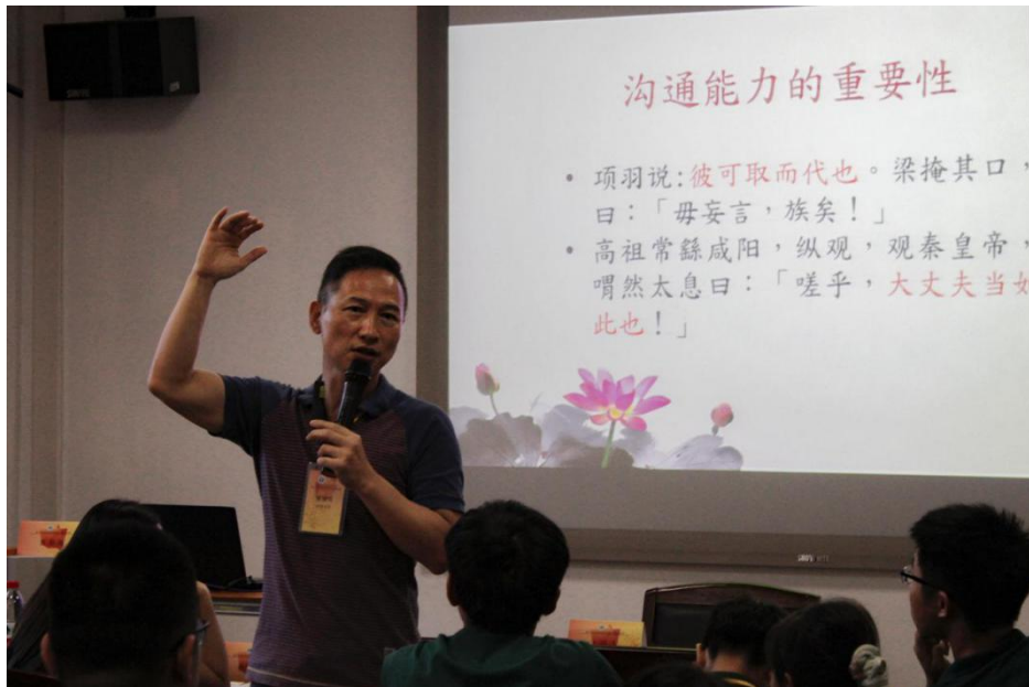
图10 楚汉相争之职场竞争力讲座