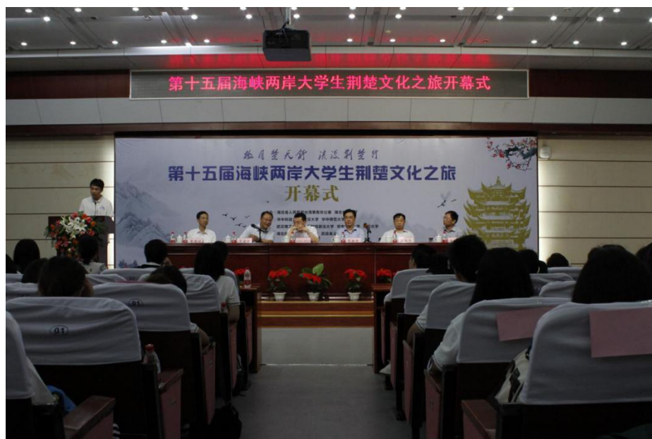
图6 湖北省第十五届海峡两岸大学生荆楚文化之旅开幕式