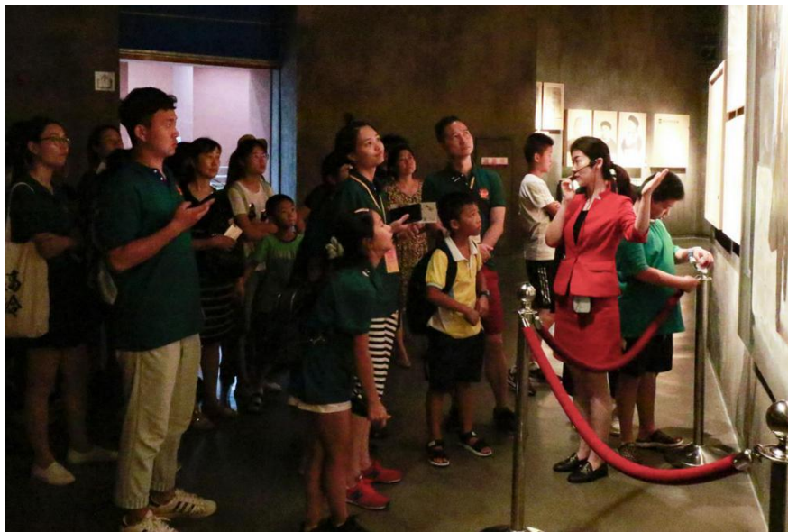
图8 辛亥革命纪念馆参访