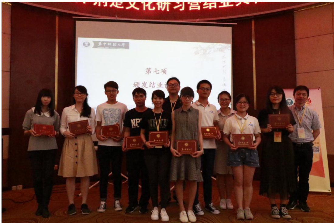
图 19 荆楚营结业典礼