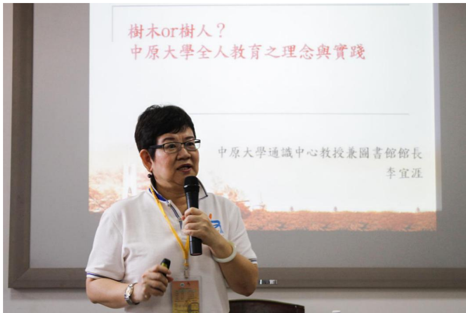
图 4 中原大学全人教育之理念与实践讲座