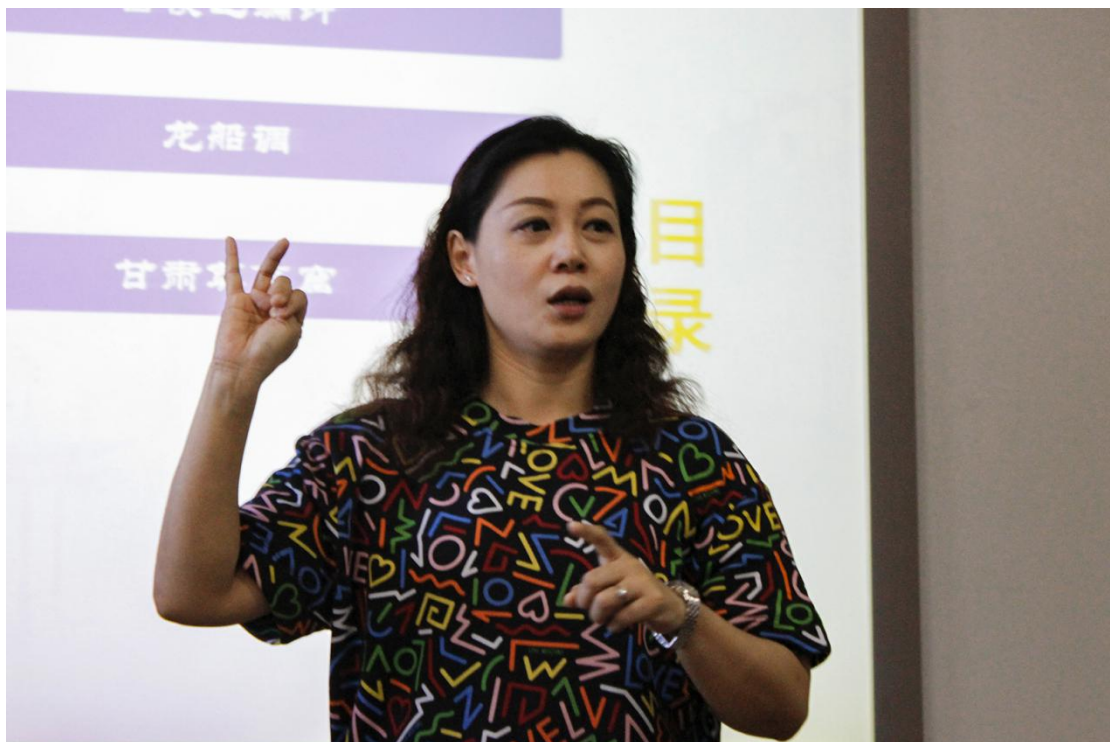
图 16 荆楚暨甘肃音乐讲座