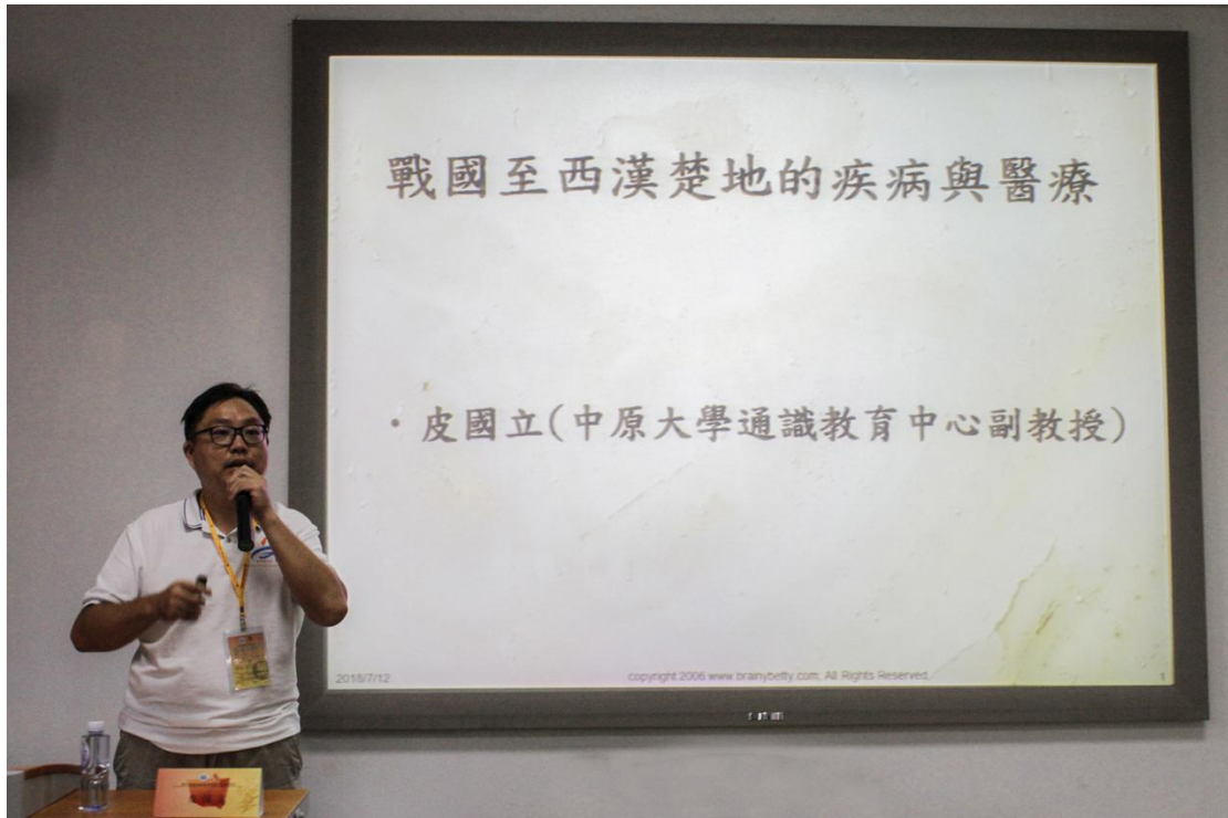
图 15 战国至西汉楚地的疾病与医疗讲座