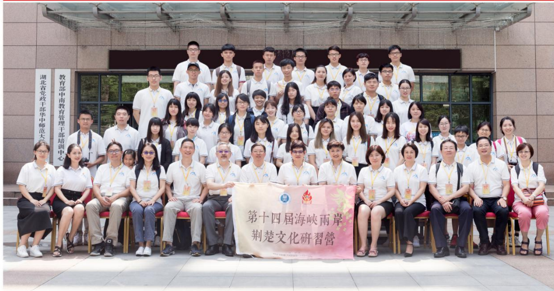
图 21 第十四届海峡两岸荆楚文化研习营大合影