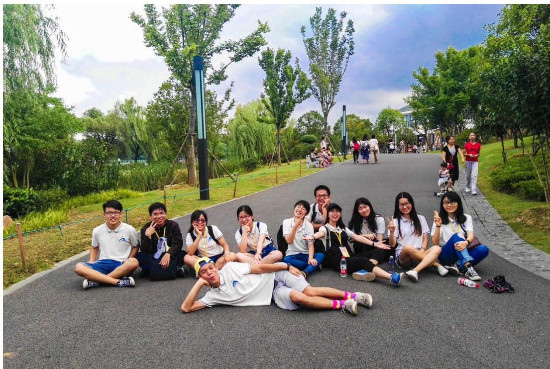
图 13 东湖绿道漫步