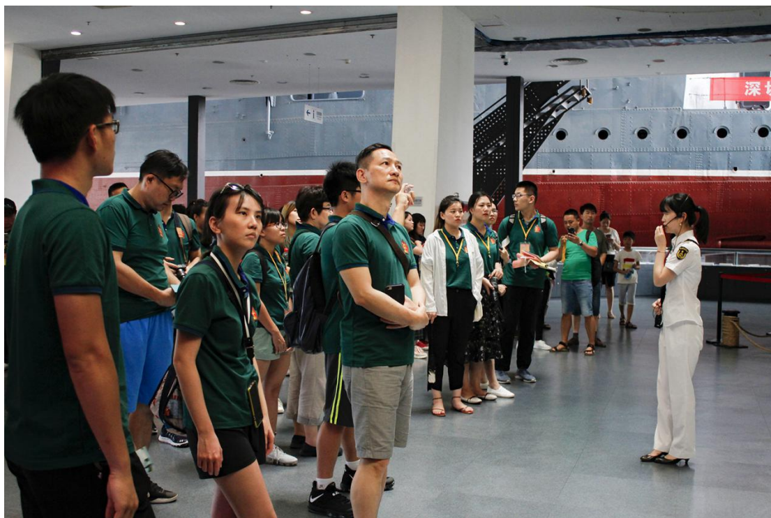
图 17 中山舰参访