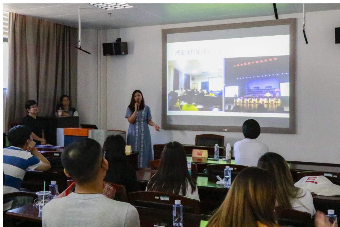
图 18 海峡两岸大学校园文化论坛