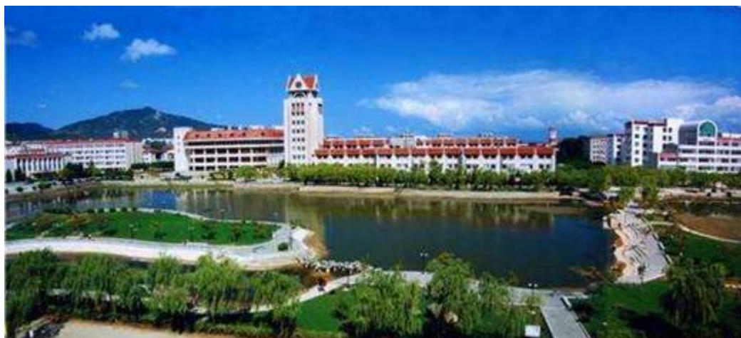
烟台大学校园景色

学术交流和友好往来，先后与 26 个国家和地区的 115 所院校和学术机构建立了友好合作关系。现设有与韩国和美国高校合作举办的中外合作办学本科项目 2 个，与美国、英国、法国、德国、日本、瑞士、韩国和台湾地区的 33 所友好院校开展校际学生交流项目。作为全国首批获准接收外国留学生及可以邀请外国文教专家的院校之一，在校留学生规模不断扩大，设有国家政府留学生奖学金、山东省政府留学生奖学金和烟台大学留学生奖学金。