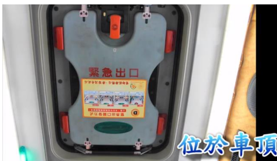
< 圖十一: 向上推開逃生天窗>