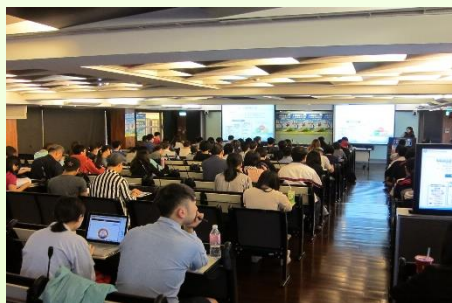
第一階段申請說明會