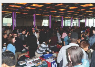
紐約大學職涯展覽