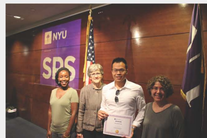
副院長、授課講師頒發證書