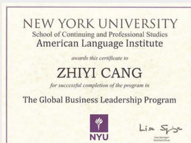
紐約大學結業證書