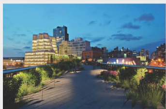
High Line 高架公園