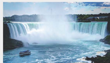
尼加拉瀑布及遊船