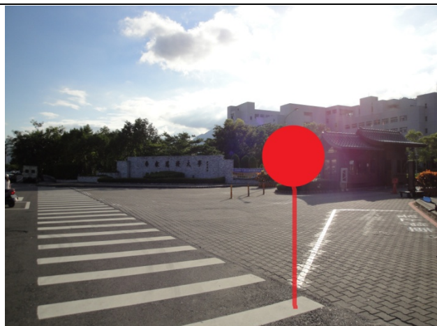
慈濟醫院、花蓮體育館、花蓮棒球場