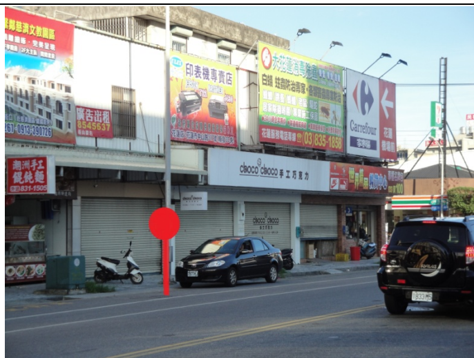
愛買、寧記、特力屋、紐約客牛排