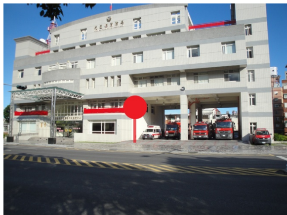
慈濟醫院、花蓮體育館、花蓮棒球場