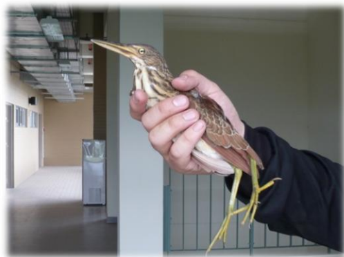
不慎撞上環院側門玻璃的栗小鷺