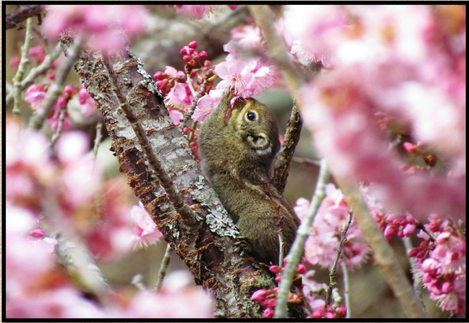
覓食中的條紋松鼠